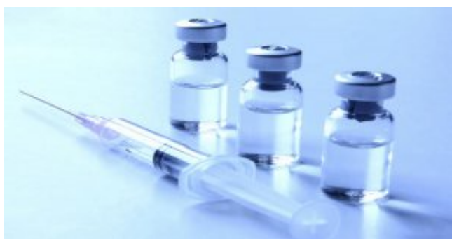
Danni da vaccini: Ministero della Salute adotta graduatoria per risarcimenti

È stata adottata lo scorso 16 gennaio, con decreto a firma del Direttore generale della Direzione generale della vigilanza sugli enti, la graduatoria relativa ai soggetti aventi titolo a beneficiare dell'indennizzo dei danni causati dai vaccini .